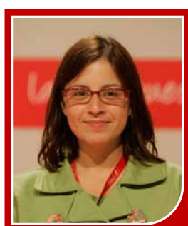
S. DE POLÍTICA MUNICIPAL ADRIANA LASTRA FERNÁNDEZ