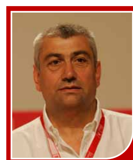
S. DE EDUCACIÓN Y CULTURA ALFONSO REY LÓPEZ