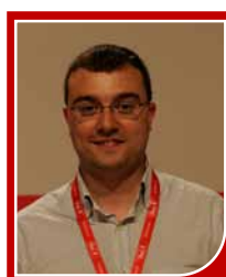
ADRIÁN BARBÓN RODRÍGUEZ