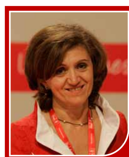
S. DE DESARROLLO SOCIOECONÓMICO Y PROGRAMAS MARÍA LUISA CARCEDO ROCES